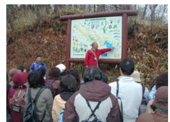
自然ガイドの解説を受ける参加者

アンケートの結果も大変高い評価を受けており、今後の観光ツアーとしての確立が期待されます。